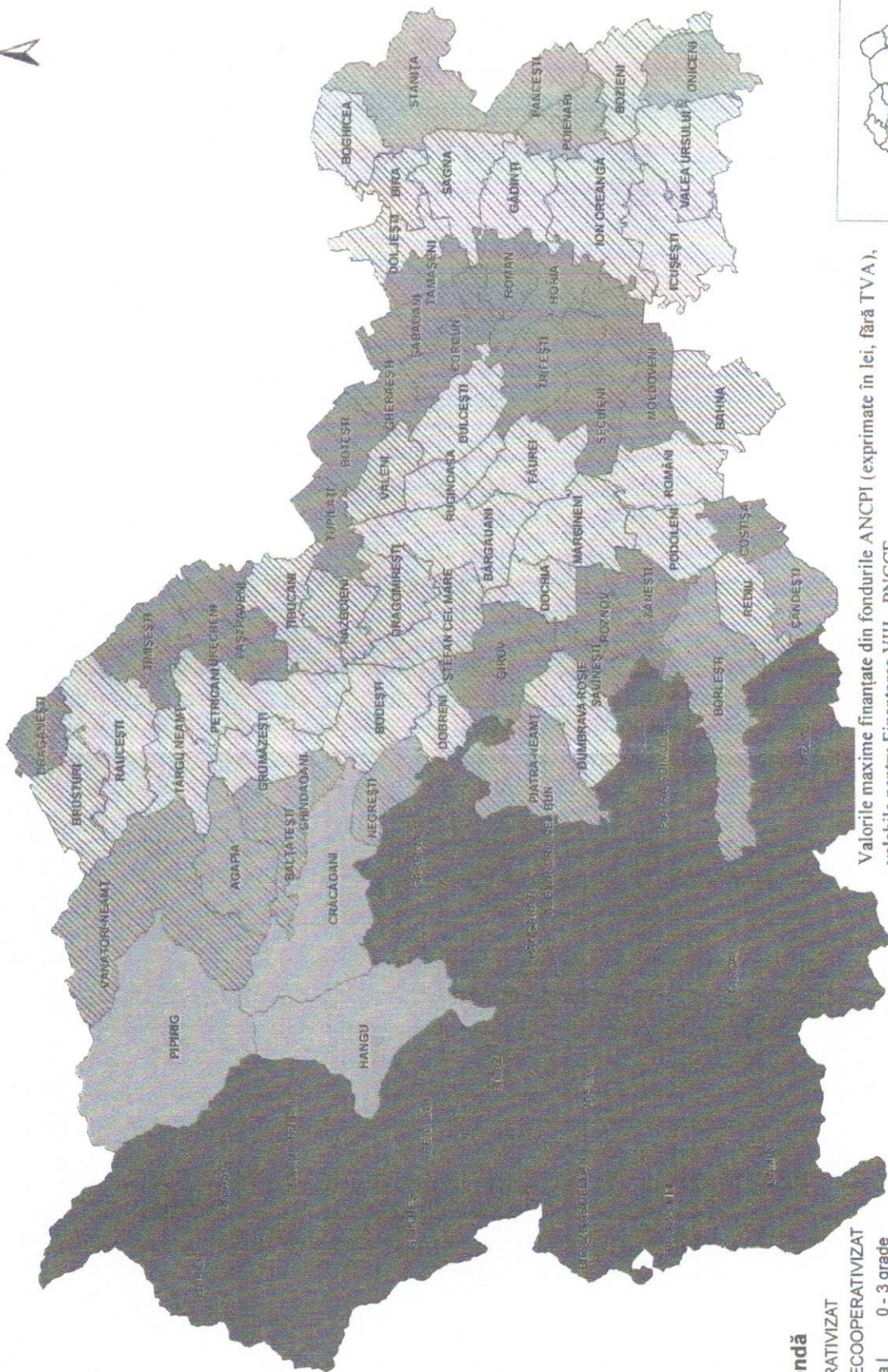
Valorile maxime finanțate din fondurile ANCP (exprimate în lei, fără TVA), valabile pentru Finanțarea VIII - PNCCF