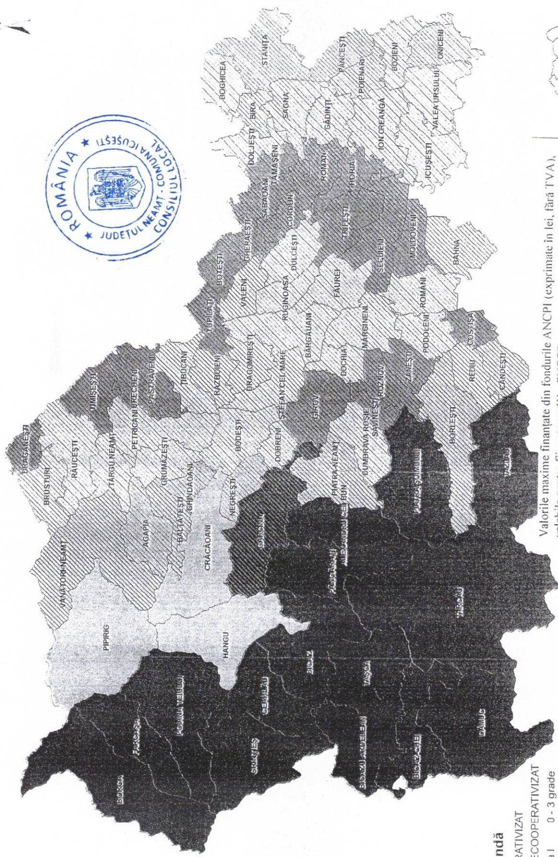
Valori maxime finanțate din fondurile ANCPJ (exprimate în lei, fără TVA), valabile pentru Finanțarea IX - PNCCF